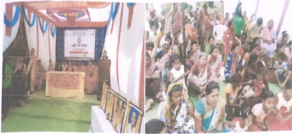
कासवी येथील 'महिला जागृती मेळाव्याची छायाचित्रे